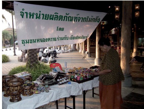
จำหน่ายผลิตภัณฑ์ไม้กลิ้ง ชุมชนหนองควาย

สำนักงานพัฒนาพิงคนครสนับสนุนการพัฒนาชุมชนด้านเศรษฐกิจ สังคม และสิ่งแวดล้อม ร่วมกับวิสาหกิจชุมชนและชุมชนอื่น ๆ โดยรอบ เป็นแหล่งรับซื้อผลิตภัณฑ์ผลการเกษตร และผักปลอดสารพิษ เป็นพื้นที่จำหน่ายผลิตภัณฑ์และให้บริการรถโดยสารจากชุมชน เกิดการกระจายรายได้แก่ชุมชนปีละไม่ต่ำกว่า ๑๓ ล้านบาท มีการเพิ่มทักษะและองค์ความรู้สู่ชุมชนในด้านต่าง ๆ เช่น จัดโครงการมัคคุเทศก์อาสาพาเที่ยวชมเชียงใหม่ไนท์ซาฟารี ร่วมฝึกและปฏิบัติงานกับเชียงใหม่ไนท์ซาฟารี เป็นการต่อยอดองค์ความรู้ อย่างยั่งยืนแก่ชุมชน เป็นต้น