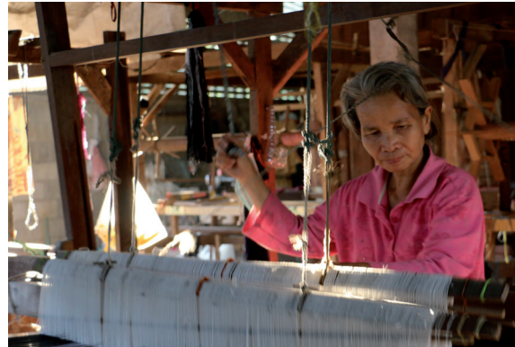
การทอผ้าพื้นเมือง