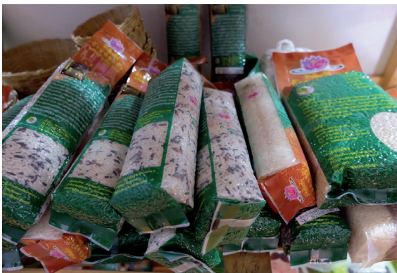
ข้าวอินทรีย์