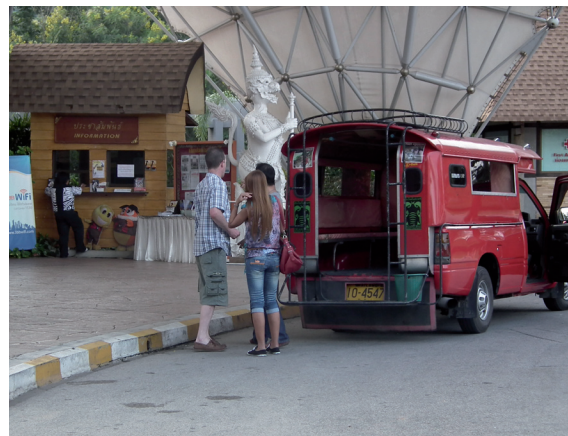
รถแดงให้บริการนักท่องเที่ยว โดยชุมชน