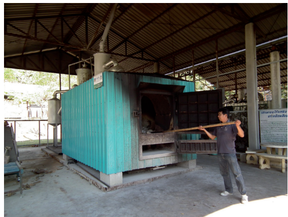
การกำจัดขยะโดยเตาเผาขยะไร่ร่มเงา แบบประหยัดพลังงาน