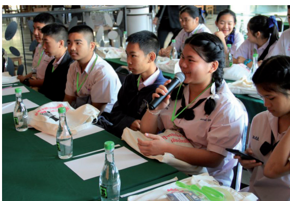
การอบรม “มัคคุเทศก์อาสาพาเที่ยวชมเชียงใหม่ไนท์ซาฟารี”