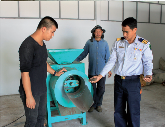
กระบวนการผลิตปุ๋ยจากมูลสัตว์ ของเชียงใหม่ไนท์ซาฟารี