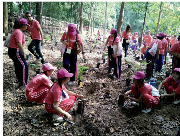
กิจกรรมปลูกพืชที่ไร่ร่มเงา