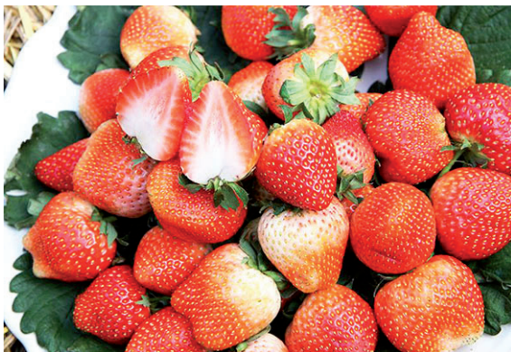
สตอเบอรี่ พันธุ์พระราชทาน ๘๐