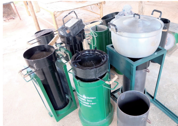
เตาอิวาเตะ