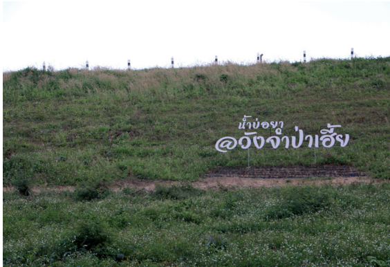
บ่อน้ำรักษาโรค