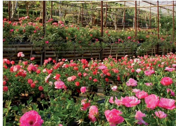
ศูนย์พัฒนาโครงการหลวงทุ่งเริง ตำบลบ้านปาง อำเภอบางคนที จังหวัดเชียงใหม่