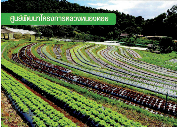
ศูนย์พัฒนาโครงการหลวงหนองหอย