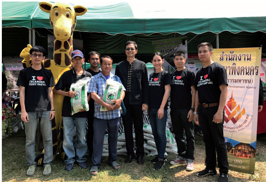
การมอบปุ๋ยมูลสัตว์ให้กับชุมชนร่วมกับ โครงการ “ผู้ว่าราชการ จังหวัดเชียงใหม่ หัวหน้าส่วนราชการ และผู้บริหาร อปท. พบปะประชาชน”