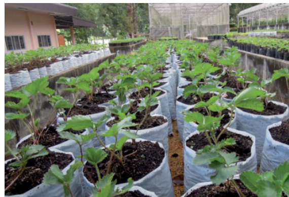
สถานีเกษตรหลวงปางดะ ตำบลสะเมิงใต้ อำเภอแม่สะเมิง จังหวัดเชียงใหม่