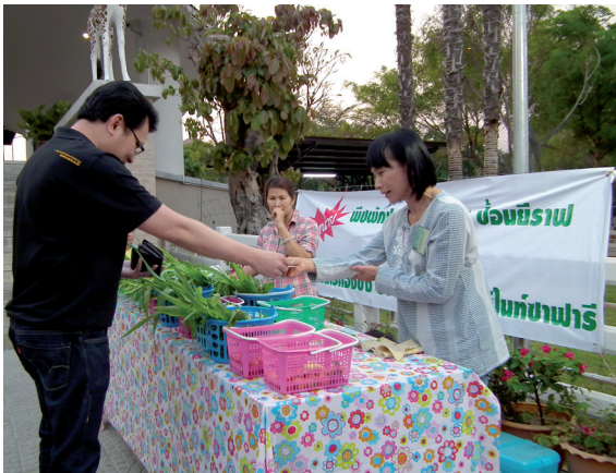
การจำหน่ายพืชผักปลอดสารพิษเป็นอาหารสัตว์ ชุมชนบ้านไร่กองซิง