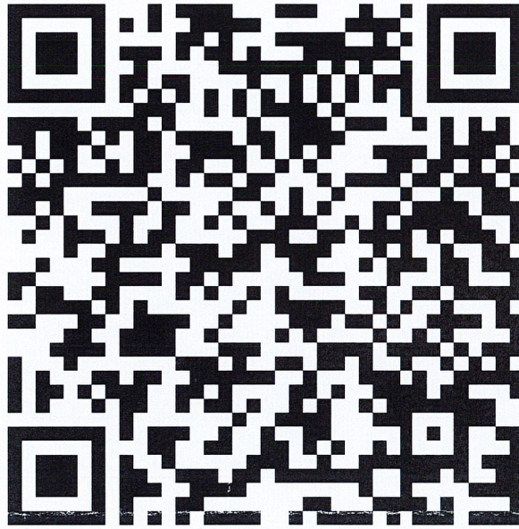
QRcode สำเนาประกาศฯ

สำเนาประกาศสำนักงาน ป.ป.ช. ลงวันที่ ๓๐ กรกฎาคม ๒๕๖๗ เรื่อง ผลการประเมินคุณธรรมและความโปร่งใส ในการดำเนินงานของหน่วยงานภาครัฐ (Integrity and Transparency Assessment: ITA) ประจำปีงบประมาณ พ.ศ. ๒๕๖๗